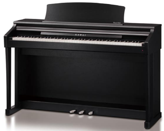
Premium Schwarz Satiniert