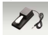
F-10H Dämpfer Pedal