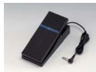
V-20X Expression Pedal