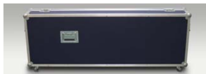
Flightcase mit Rollen